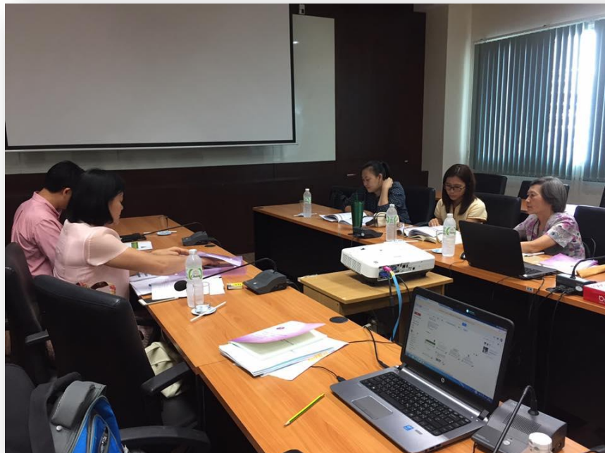
คณะกรรมการประเมินประชุมสรุปผลการตรวจประเมินและเตรียมการเสนอผลเบื้องต้นด้วยวาจา